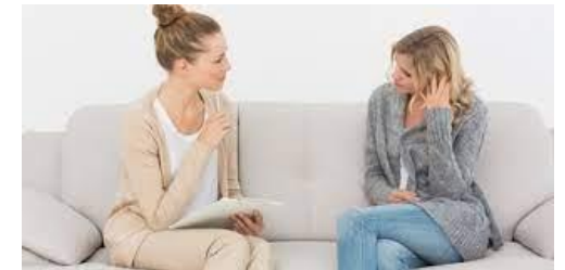
Mucha practica de Coaching